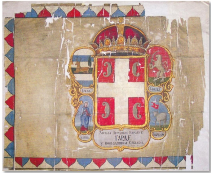
Застава Земунске народне гарде у Војводини Српској из 1848. године

(Наведено дело, Београд, 2008, стр. 554). У фусноти на то још додаје: „Румски и Илочки округ Сремске жупаније били су Патентом укључени у Војводство, док Барања није, па се можда хтела нагласити претензија према Барањи тиме што се Илок, као територијално њој најближи део Војводства, тенденциозно пројектовао у Барању“.