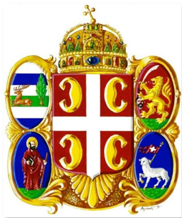
Идеална реконструкција хералдичке композиције са заставе Земунске народне гарде, аутор Д. Ацовић

На мађарском језику именица bárány значи јагње, што нам поручује да је грб Барање заправо arma parlante , а што нам је до данас остало непознато јер тај грб никада и нисмо посматрали кроз призму мађарског језика. То је донекле и оправдано, јер у мађарској хералдици бар до сада није примећен сличан грб приписан Барањи, док се у српској хералдици први пут јавља тек у овом примеру из 1848. године.