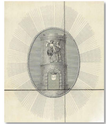
Грб Барањске жупаније из 1838. године

До одговора ће нас одвести траг који се недавно појавио, и то из области која у проучавању хералдике није страна, али која сплетом околности није била посматрана кроз праву призму. Одгонетка симболике грба Барање са заставе Земунске гарде из 1848. године лежи заправо у језику.